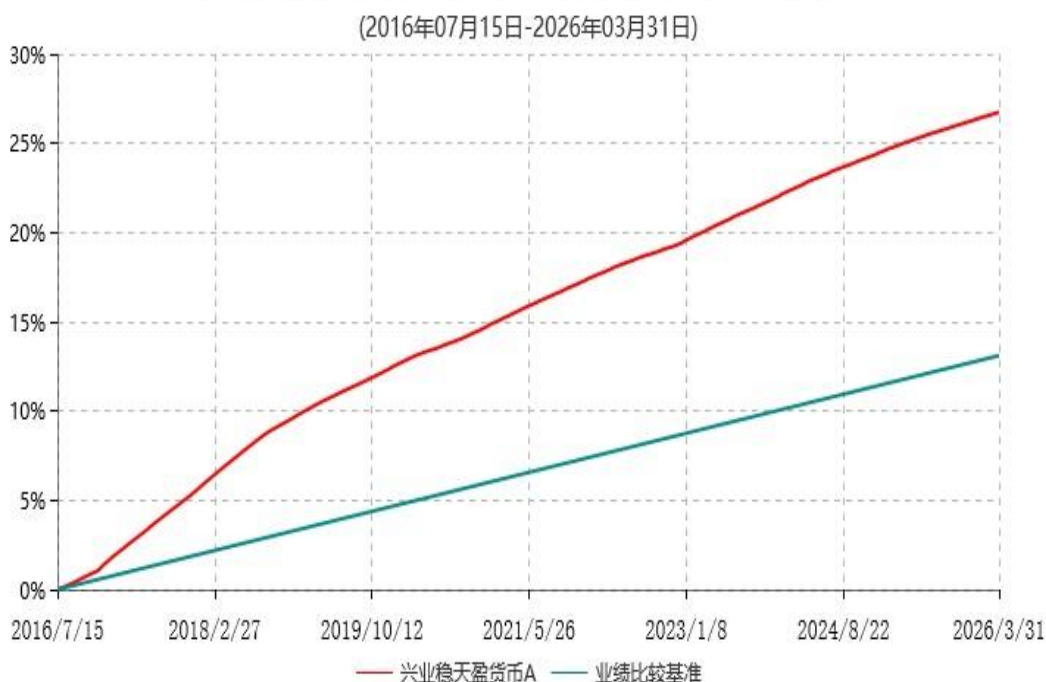
兴业稳天盈货币A累计净值收益率与业绩比较基准收益率历史走势对比图