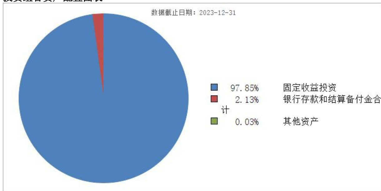
投资组合资产配置图表