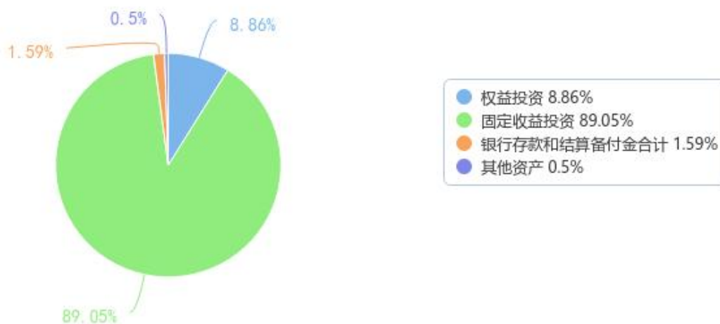
投资组合资产配置图表（数据截至日期：2023年09月30日）