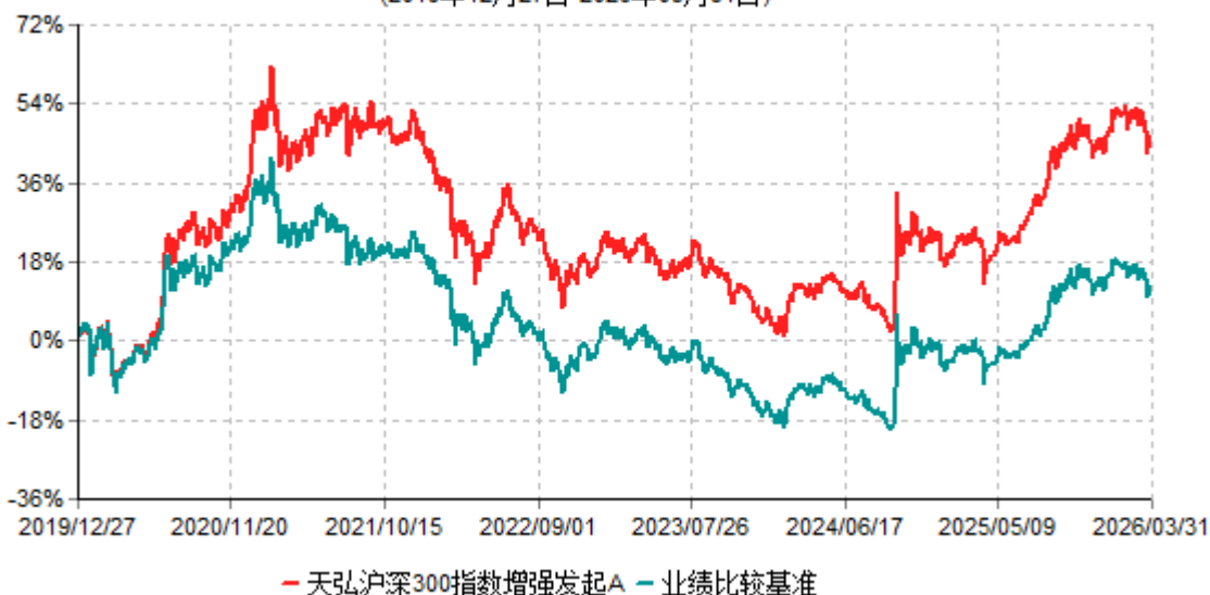
天弘沪深300指数增强发起A累计净值增长率与业绩比较基准收益率历史走势对比图 (2019年12月27日-2026年03月31日)