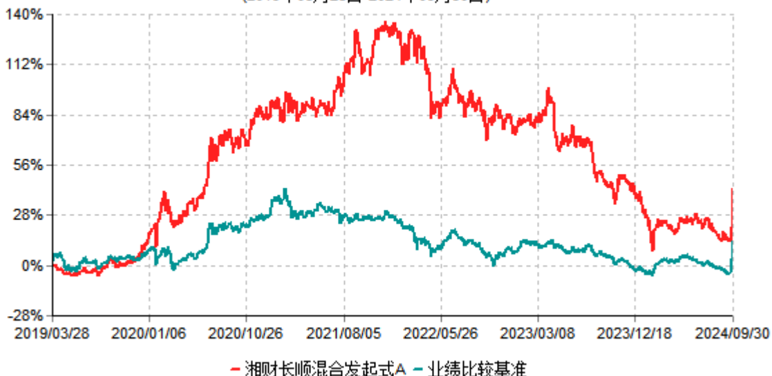
湘财长顺混合发起式A累计净值增长率与业绩比较基准收益率历史走势对比图 (2019年03月28日-2024年09月30日)