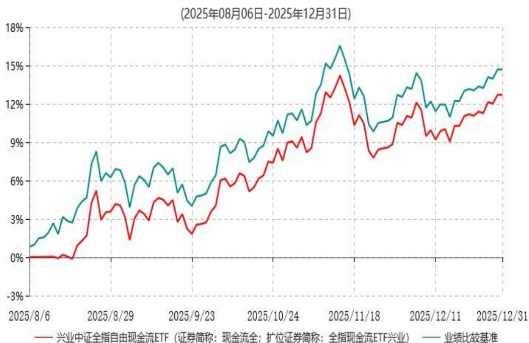
兴业中证全指自由现金流交易型开放式指数证券投资基金累计净值增长率与业绩比较基准收益率历史走势对比图

注：1、本基金基金合同于2025年08月06日生效，截至报告期末本基金基金合同生效未满一年。