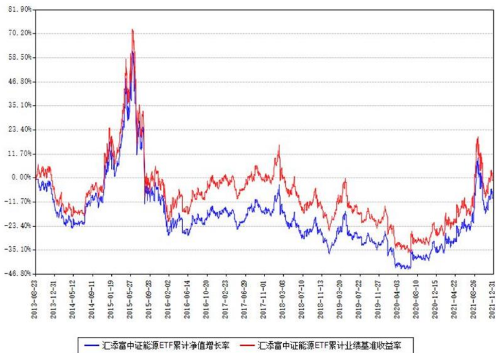
汇添富中证能源ETF累计净值增长率与同期业绩基准收益率对比图