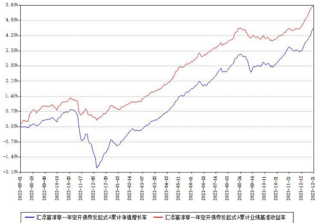
汇添富淳享一年定开债券发起式A累计净值增长率与同期业绩基准收益率对比图

注：本基金建仓期为本《基金合同》生效之日（2022年08月01日）起6个月，建仓期结束时各项资产配置比例符合合同约定。