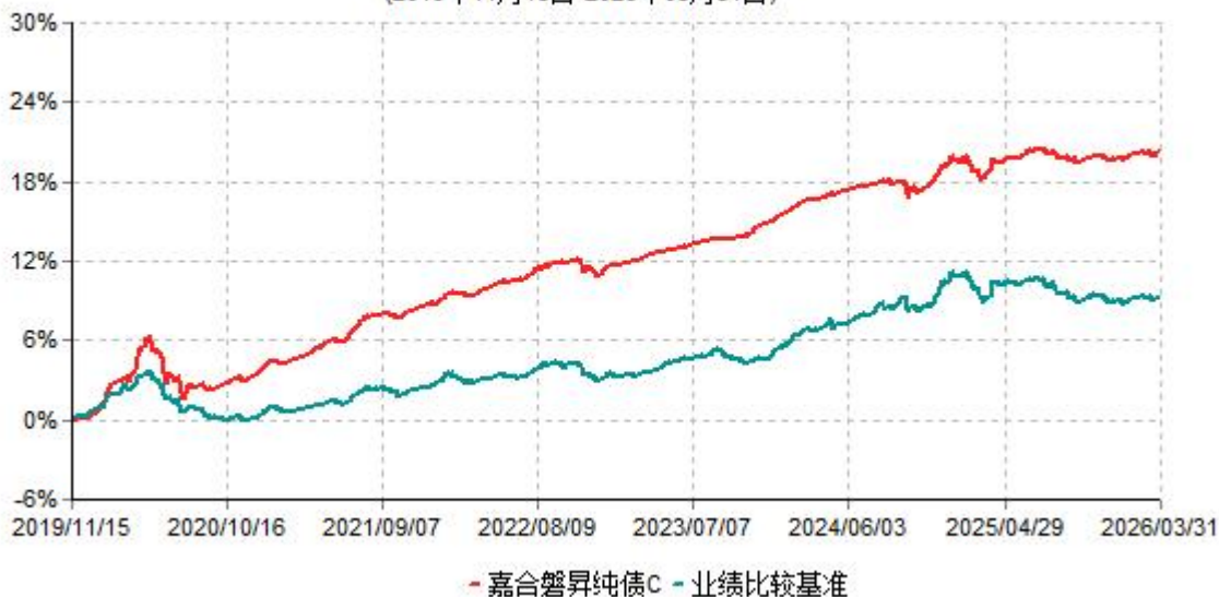
嘉合磐昇纯债C累计净值增长率与业绩比较基准收益率历史走势对比图 (2019年11月15日-2026年03月31日)