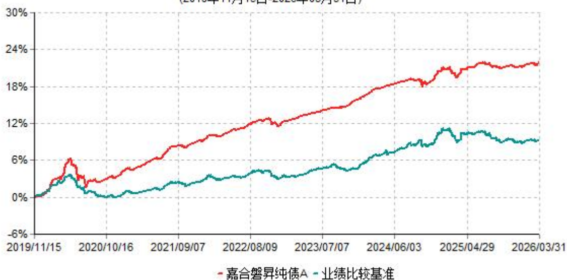
嘉合磐昇纯债A累计净值增长率与业绩比较基准收益率历史走势对比图 (2019年11月15日-2026年03月31日)