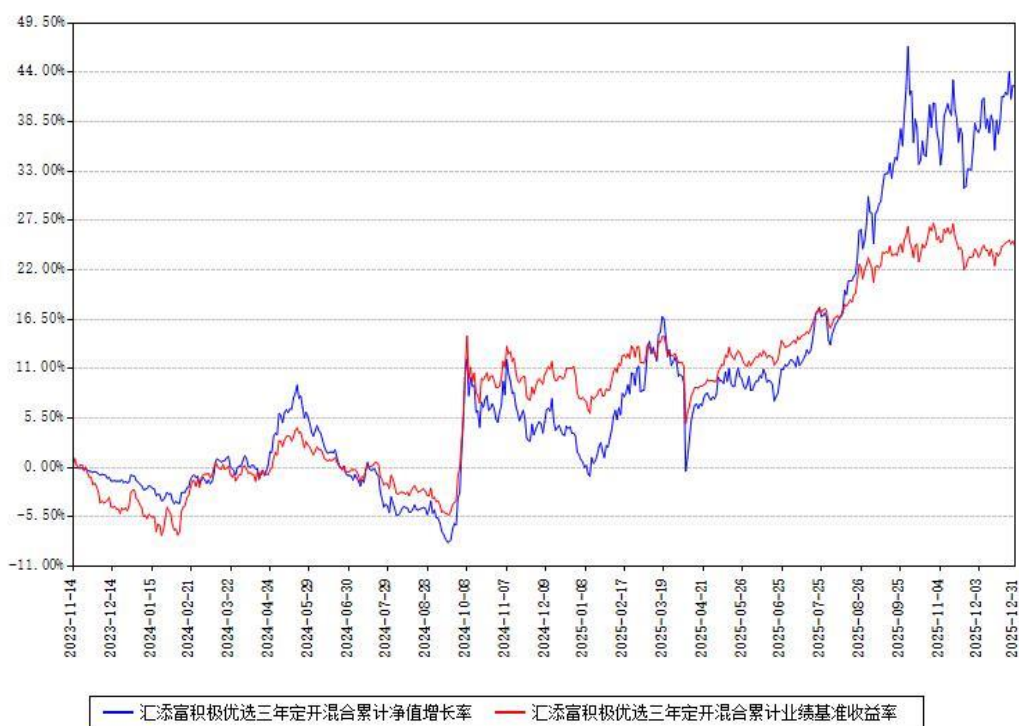
汇添富积极优选三年定开混合累计净值增长率与同期业绩比较基准收益率对比图

注：本基金建仓期为本《基金合同》生效之日（2023 年 11 月 14 日）起 6 个月，建仓期结束时各项资产配置比例符合合同约定。