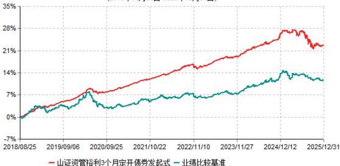
山证资管裕利3个月定开债券发起式累计净值增长率与业绩比较基准收益率历史走势对比图 (2018年08月25日-2025年12月31日)