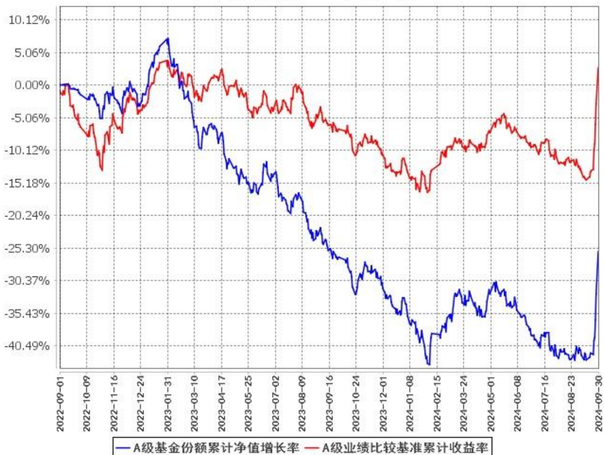
A级基金份额累计净值增长率与同期业绩比较基准收益率的历史走势对比图 (2022年9月1日至2024年9月30日)