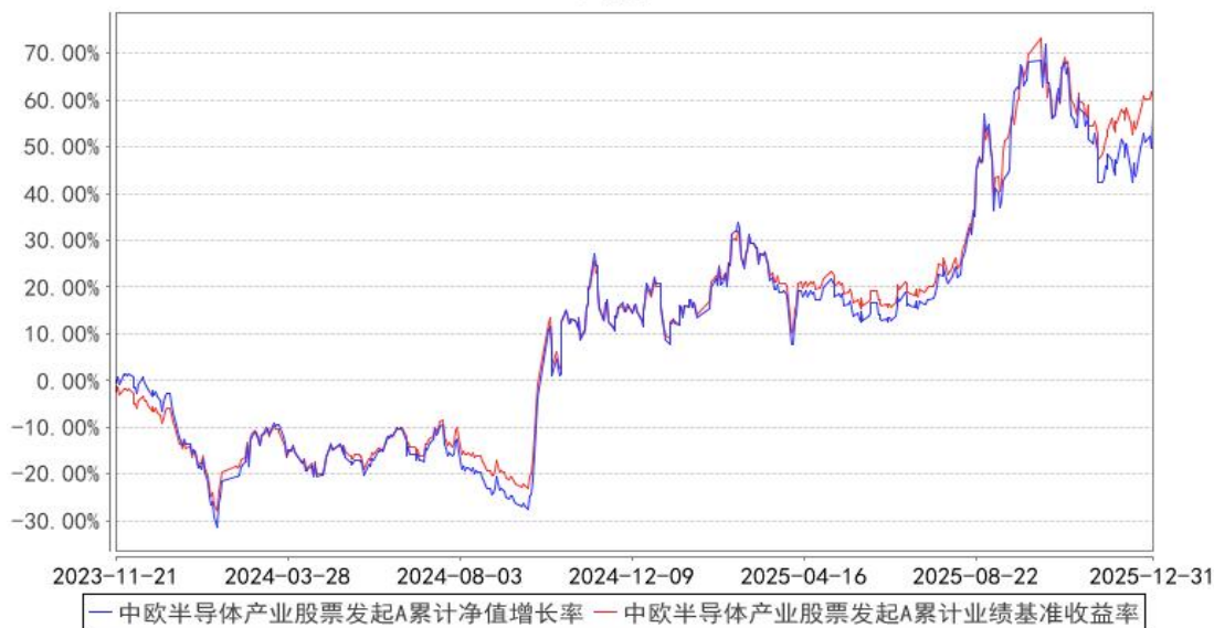
中欧半导体产业股票发起A累计净值增长率与同期业绩比较基准收益率的历史走势对比图