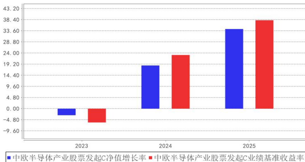
中欧半导体产业股票发起C基金每年净值增长率与同期业绩比较基准收益率的对比图

注：本基金合同生效日为 2023 年 11 月 21 日，2023 年度数据为 2023 年 11 月 21 日至 2023 年 12 月 31 日数据。