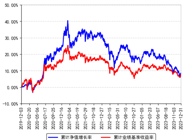
南方养老目标日期2030三年持有混合发起（FOF）A累计净值增长率与同期业绩比较基准收益率的历史走势对比图