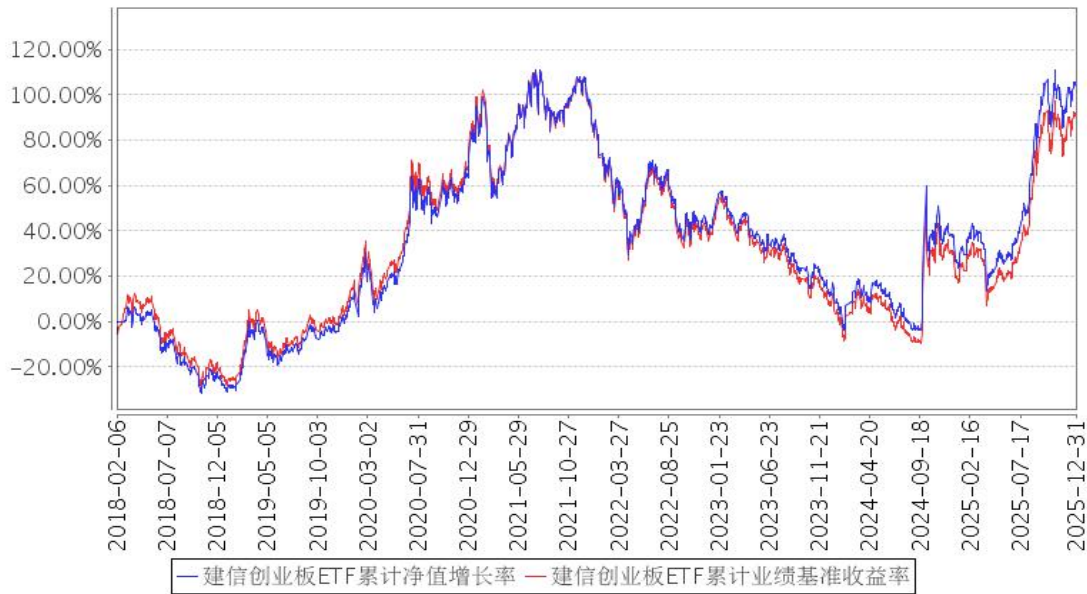
建信创业板ETF累计净值增长率与同期业绩比较基准收益率的历史走势对比图