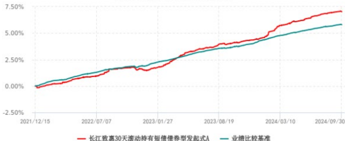
长江致惠30天滚动持有短债债券型发起式A累计净值增长率与业绩比较基准收益率历史走势对比图 (2021年12月15日-2024年09月30日)

注：本基金 A 类份额“自基金合同生效以来”的报告期为 2021 年 12 月 15 日至 2024 年 09 月 30 日。