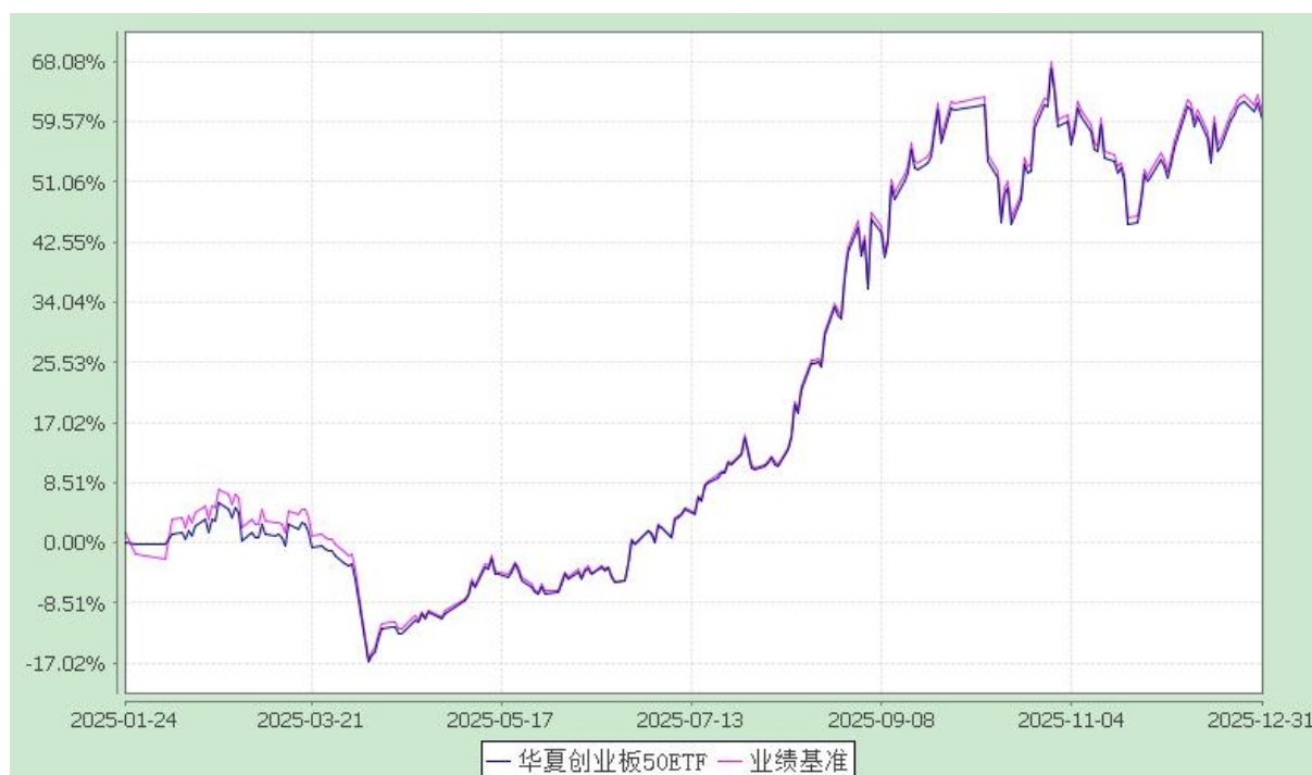
华夏创业板 50 交易型开放式指数证券投资基金 份额累计净值增长率与业绩比较基准收益率历史走势对比图 (2025 年 1 月 24 日至 2025 年 12 月 31 日)