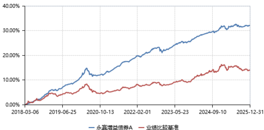
永赢增益债券A累计净值收益率与业绩比较基准收益率历史走势对比图 (2018年03月06日-2025年12月31日)

注：本基金建仓期为本基金合同生效日起 6 个月，建仓期结束当日，除债券投资比例未达到合同约定外，其他各项资产配置符合合同约定。债券投资比例未达到合同约定系交易对手原因导致现券买入交易结算失败所致，本基金于 2018 年 9 月 6 日及时买入债券将债券投资比例提高至合同约定的范围内。