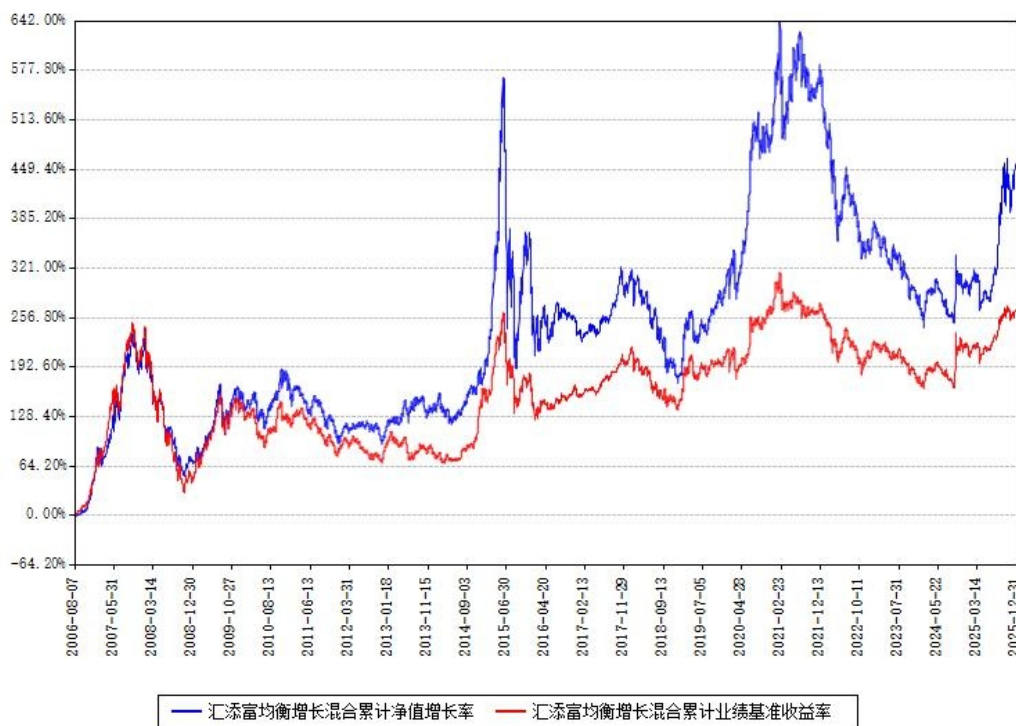
汇添富均衡增长混合累计净值增长率与同期业绩比较基准收益率对比图

注：本基金建仓期为本《基金合同》生效之日（2006年08月07日）起6个月，建仓期结束时各项资产配置比例符合合同约定。