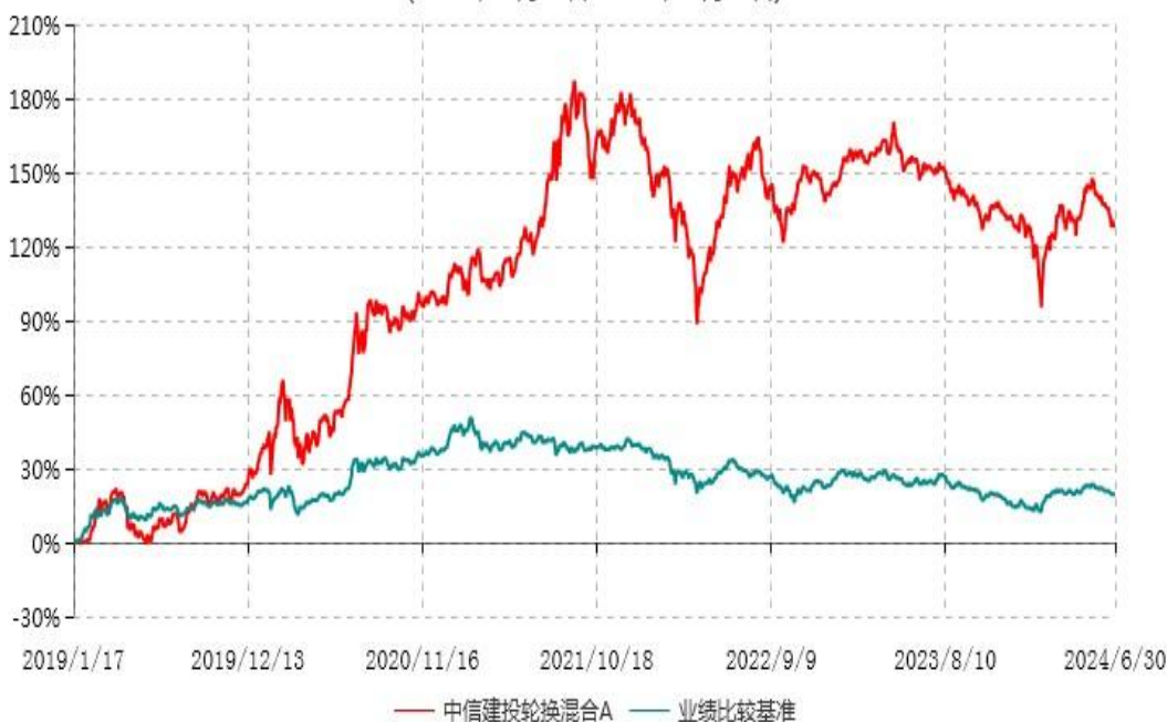
中信建投轮换混合A累计净值增长率与业绩比较基准收益率历史走势对比图 (2019年01月17日-2024年06月30日)