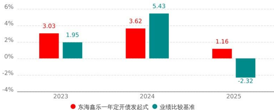
基金的过往业绩不代表未来表现，数据截止日：2025年12月31日

注：本基金合同于 2023 年 3 月 17 日生效，合同生效当年按实际存续期计算，不按整个自然年度进行折算。业绩表现截止日期 2025 年 12 月 31 日。基金过往业绩不代表未来表现。