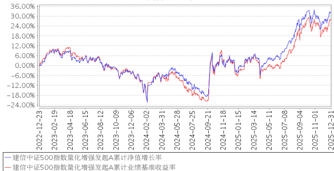
建信中证500指数量化增强发起A累计净值增长率与同期业绩比较基准收益率的历史走势对比图