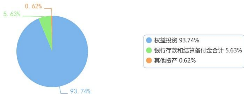
投资组合资产配置图表（数据截至日期：2026年03月31日）