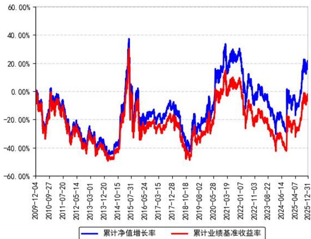
南方深证成份ETF累计净值增长率与同期业绩比较基准收益率的历史走势对比图