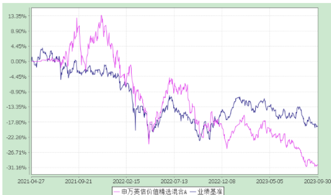
申万菱信价值精选混合 C :