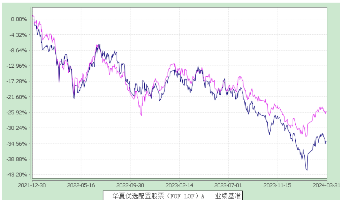
华夏优选配置股票（FOF）C: