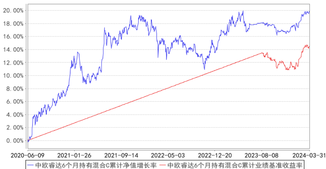
中欧睿达6个月持有混合C累计净值增长率与同期业绩比较基准收益率的历史走势对比图

注：2023 年 8 月 11 日起组合业绩比较基准变更为中债综合财富(总值)指数收益率*80%+沪深 300 指数收益率*17%+中证港股通综合指数(人民币)收益率*3%。本基金于 2020 年 6 月 5 日新增 C 份额，图示日期为 2020 年 6 月 9 日至 2024 年 03 月 31 日。