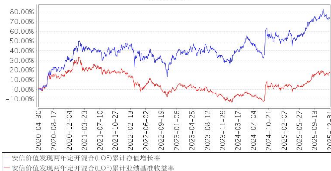
安信价值发现两年定开混合(LOF)累计净值增长率与同期业绩比较基准收益率的历史走势对比图