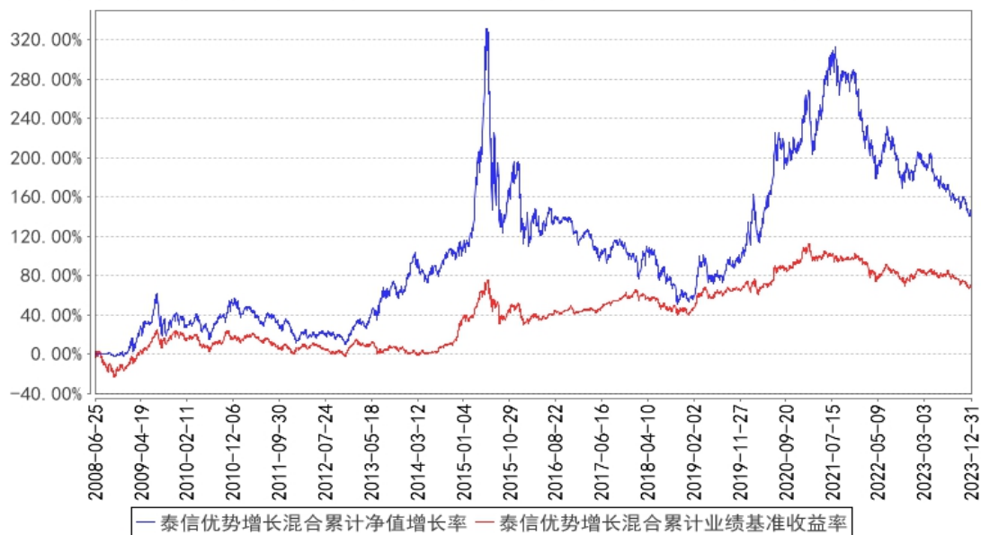
泰信优势增长混合累计净值增长率与同期业绩比较基准收益率的历史走势对比图