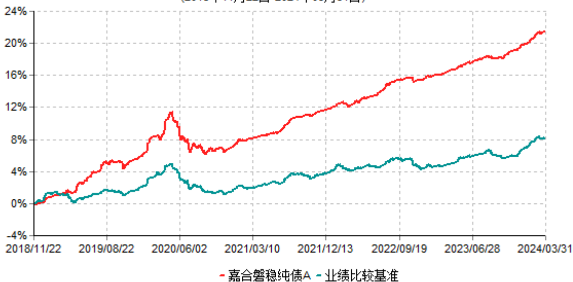
嘉合磐稳纯债A累计净值增长率与业绩比较基准收益率历史走势对比图 (2018年11月22日-2024年03月31日)