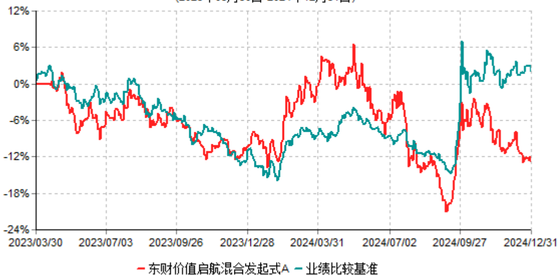
东财价值启航混合发起式A累计净值增长率与业绩比较基准收益率历史走势对比图 (2023年03月30日-2024年12月31日)