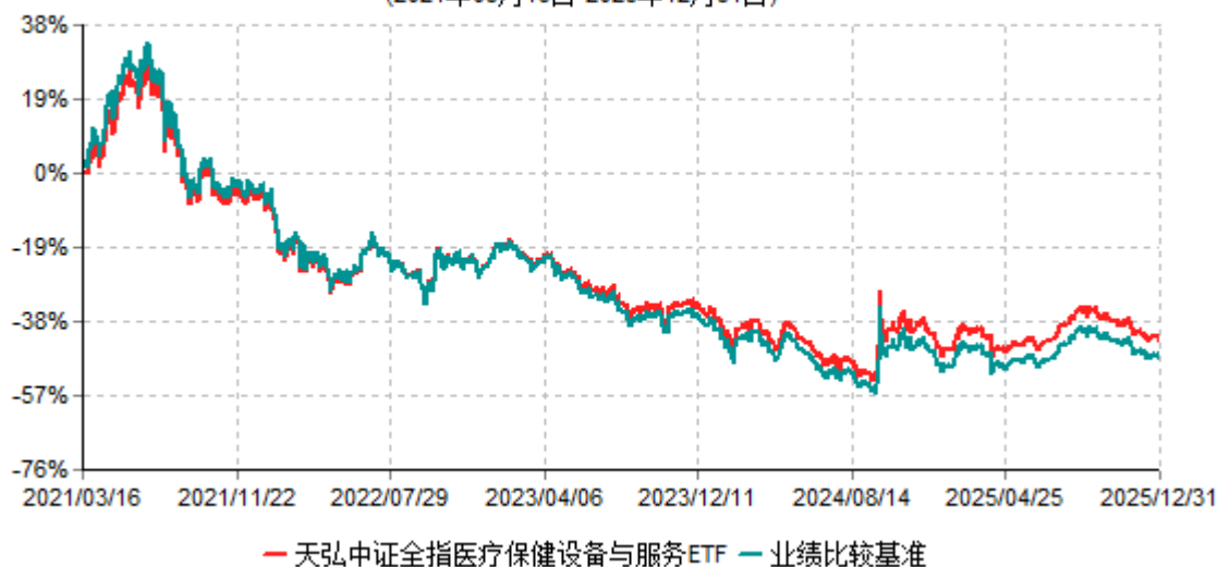
天弘中证全指医疗保健设备与服务ETF累计净值增长率与业绩比较基准收益率历史走势对比图 (2021年03月16日-2025年12月31日)

注：1、本基金合同于2021年03月16日生效。 2、本报告期内，本基金的各项投资比例达到基金合同约定的各项比例要求。