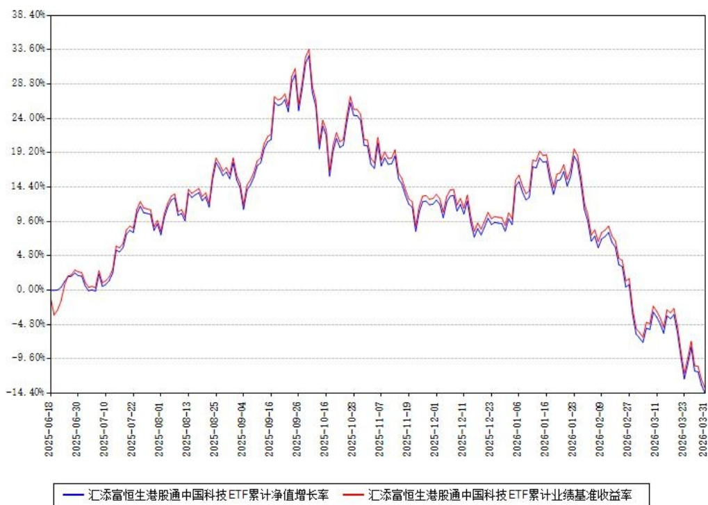
汇添富恒生港股通中国科技ETF累计净值增长率与同期业绩基准收益率对比图

(二) 自基金合同生效以来基金累计净值增长率变动及其与同期业绩比较基准收益率变动的比较图