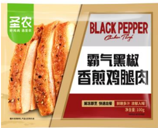
霸气黑椒香煎鸡腿肉