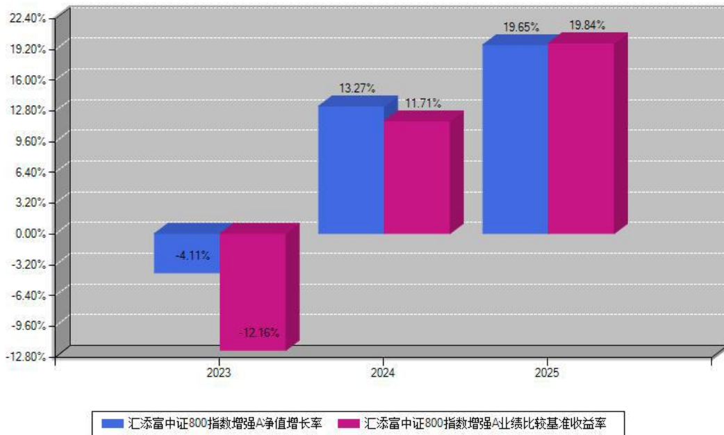
汇添富中证800指数增强A每年净值增长率与同期业绩基准收益率对比图

注：数据截止日期为2025年12月31日，基金的过往业绩不代表未来表现。本《基金合同》生效之日为2023年05月19日，合同生效当年按实际存续期计算，不按整个自然年度进行折算。