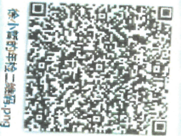
徐小哲的年检二维码.png

本证书经检验合格 This certificate is vali this renewal.