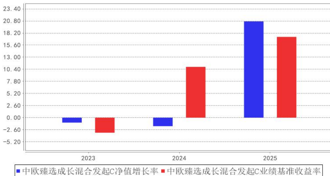
中欧臻选成长混合发起C基金每年净值增长率与同期业绩比较基准收益率的对比图

注：本基金合同生效日为 2023 年 11 月 17 日，2023 年度数据为 2023 年 11 月 17 日至 2023 年 12 月 31 日数据。