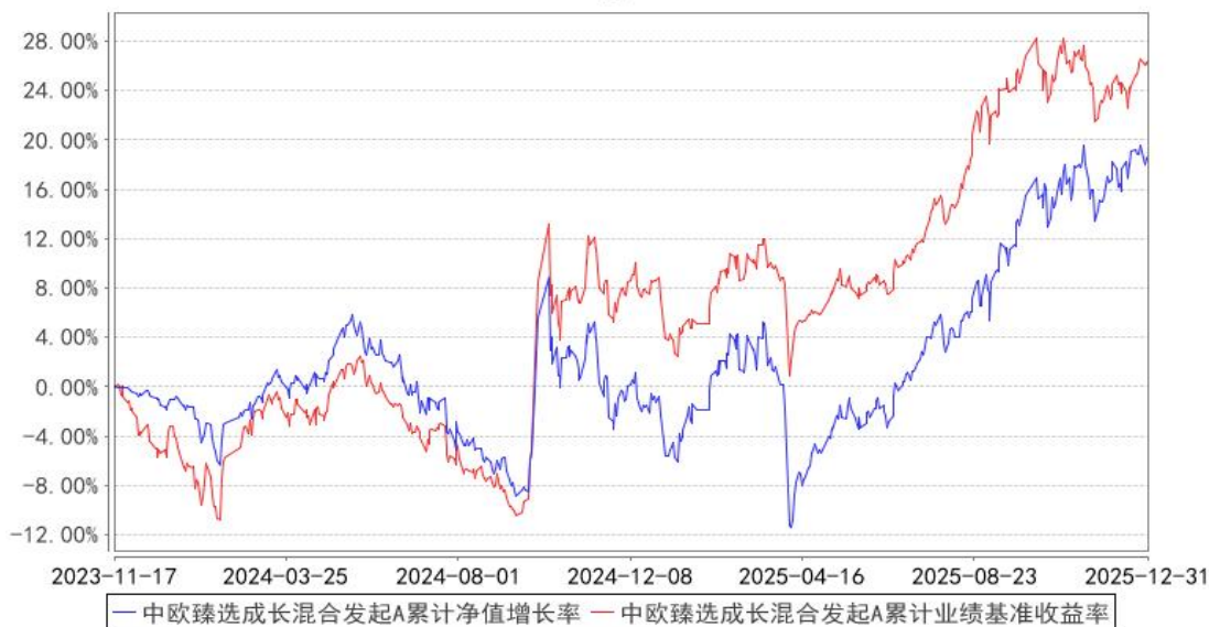
中欧臻选成长混合发起A累计净值增长率与同期业绩比较基准收益率的历史走势对比图