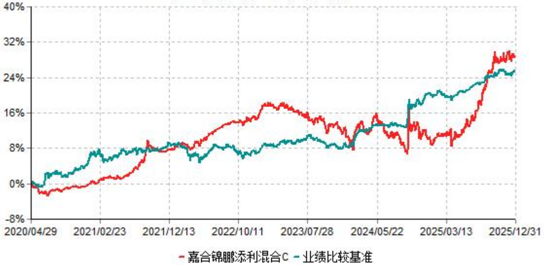
嘉合锦鹏添利混合C累计净值增长率与业绩比较基准收益率历史走势对比图 (2020年04月29日-2025年12月31日)