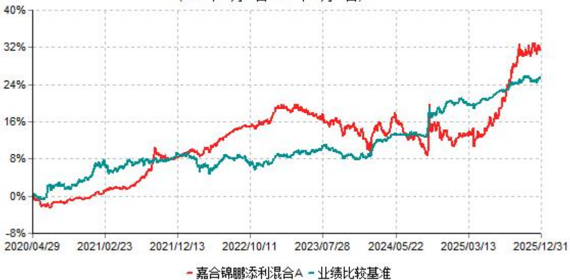
嘉合锦鹏添利混合A累计净值增长率与业绩比较基准收益率历史走势对比图 (2020年04月29日-2025年12月31日)