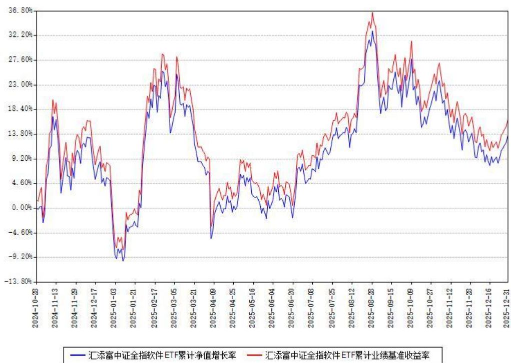
汇添富中证全指软件ETF累计净值增长率与同期业绩基准收益率对比图

注：本基金建仓期为本《基金合同》生效之日（2024年10月28日）起6个月，建仓期结束时各项资产配置比例符合合同约定。