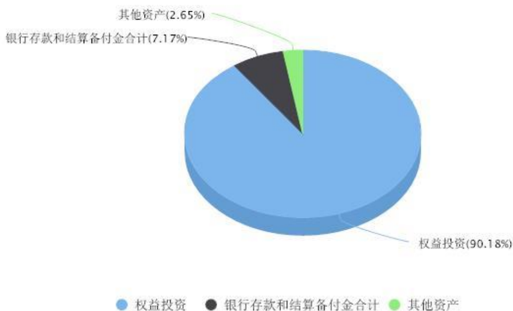
投资组合资产配置图表 数据截止日期:2024年09月30日