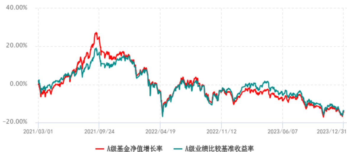
A级基金份额累计净值增长率与同期业绩比较基准收益率历史走势对比图 (2021年03月01日-2023年12月31日)