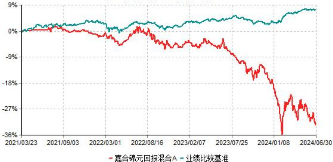
嘉合锦元回报混合A累计净值增长率与业绩比较基准收益率历史走势对比图 (2021年03月23日-2024年06月30日)