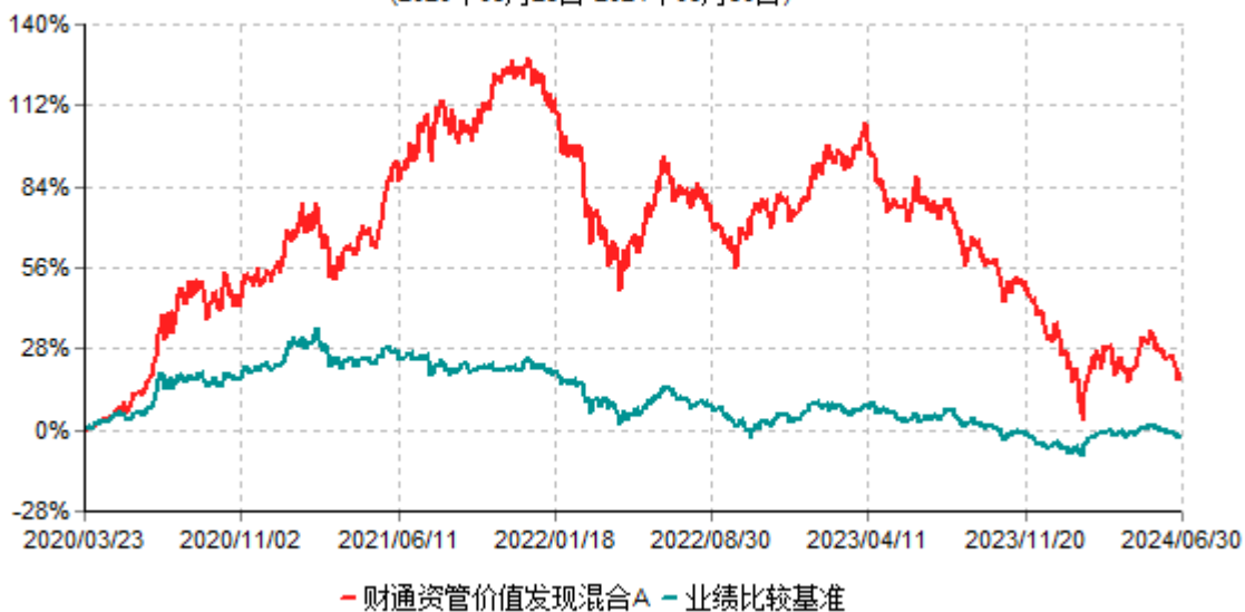
财通资管价值发现混合A累计净值增长率与业绩比较基准收益率历史走势对比图 (2020年03月23日-2024年06月30日)