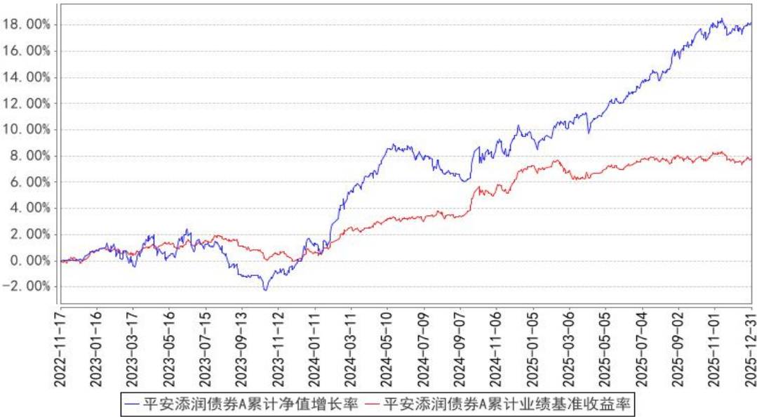
平安添润债券A累计净值增长率与同期业绩比较基准收益率的历史走势对比图