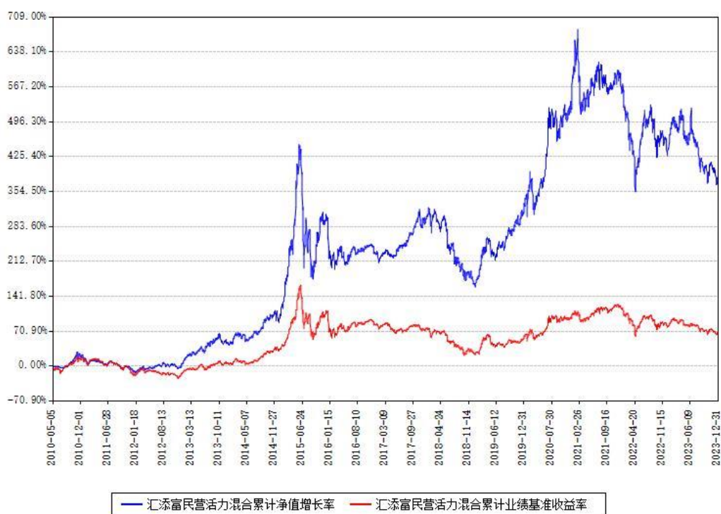
汇添富民营活力混合累计净值增长率与同期业绩比较基准收益率对比图

注：本基金建仓期为本《基金合同》生效之日（2010年05月05日）起6个月，建仓期结束时各项资产配置比例符合合同约定。