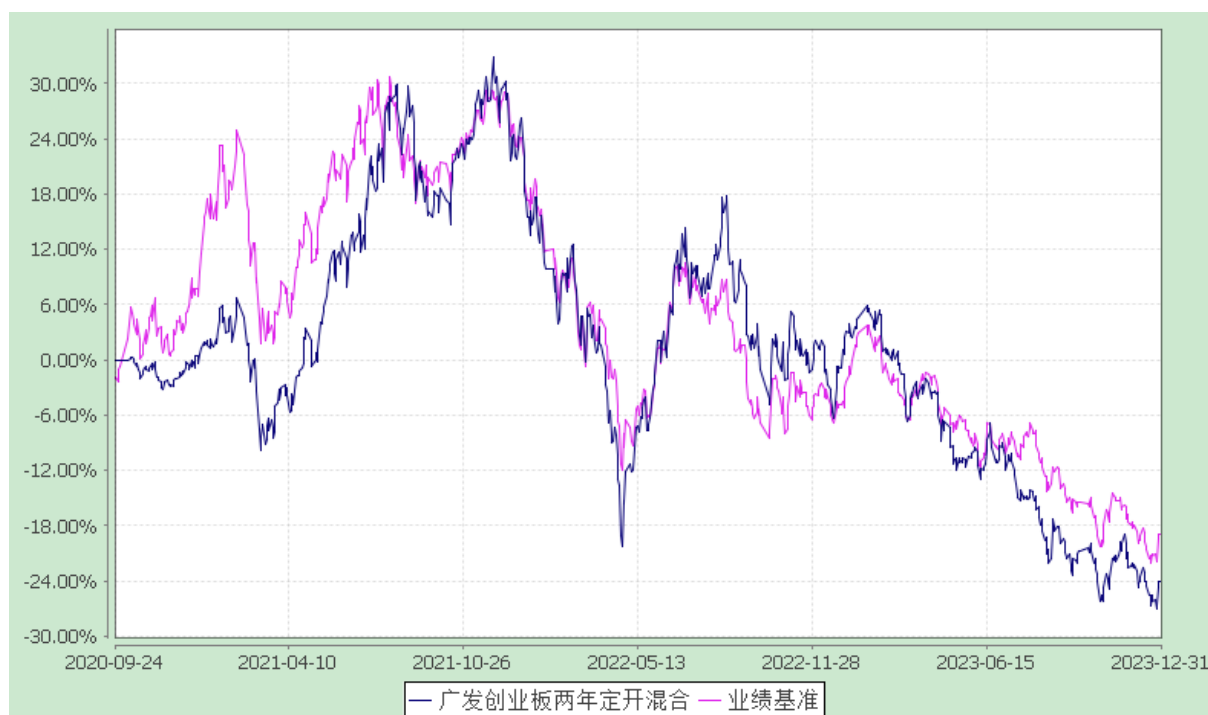
广发创业板两年定期开放混合型证券投资基金 份额累计净值增长率与业绩比较基准收益率的历史走势对比图 (2020 年 9 月 24 日至 2023 年 12 月 31 日)