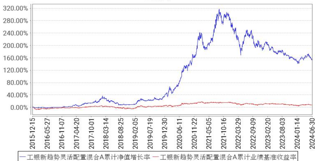
工银新趋势灵活配置混合A累计净值增长率与同期业绩比较基准收益率的历史走势对比图