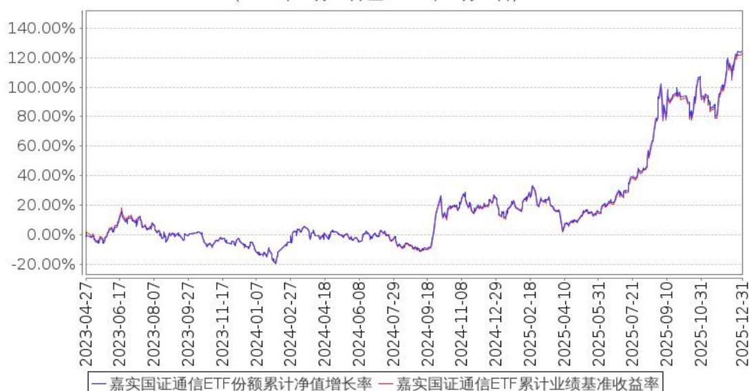
嘉实国证通信ETF份额累计净值增长率与同期业绩比较基准收益率的历史走势对比图 (2023年04月27日至2025年12月31日)

注：按基金合同和招募说明书的约定，本基金自基金合同生效日起6个月为建仓期，建仓期结束时本基金的各项资产配置比例符合基金合同约定。