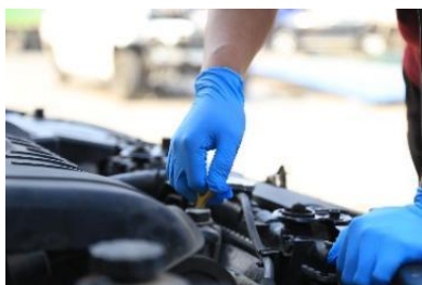
工业劳保领域应用

一次性丁腈手套，是一种人工合成橡胶手套，是以丁腈胶乳为主要原料，采用浸渍工艺硫化成型的优质防护手套。丁腈胶乳是一种由丙烯腈、丁二烯和羧基组成的合成聚合物，不含蛋白原，因而具有不会使人产生过敏与皮炎的优异特性。丁腈胶乳耐化学溶剂的腐蚀，用其生产的手套在机械性能、ESD 性能、NVR 测试、可提取离子含量和 LPC 测试等指标方面表现优良，并具备优异的耐油性、较高的抗张强度、极好的耐磨耐穿刺性、优异的拉伸性能和防静电性，在柔软性、舒适性、清洁性和贴手性方面具有良好体验。一次性丁腈手套目前已经广泛应用于医疗检查、工业劳保（化工、电子等）及餐饮服务等领域。