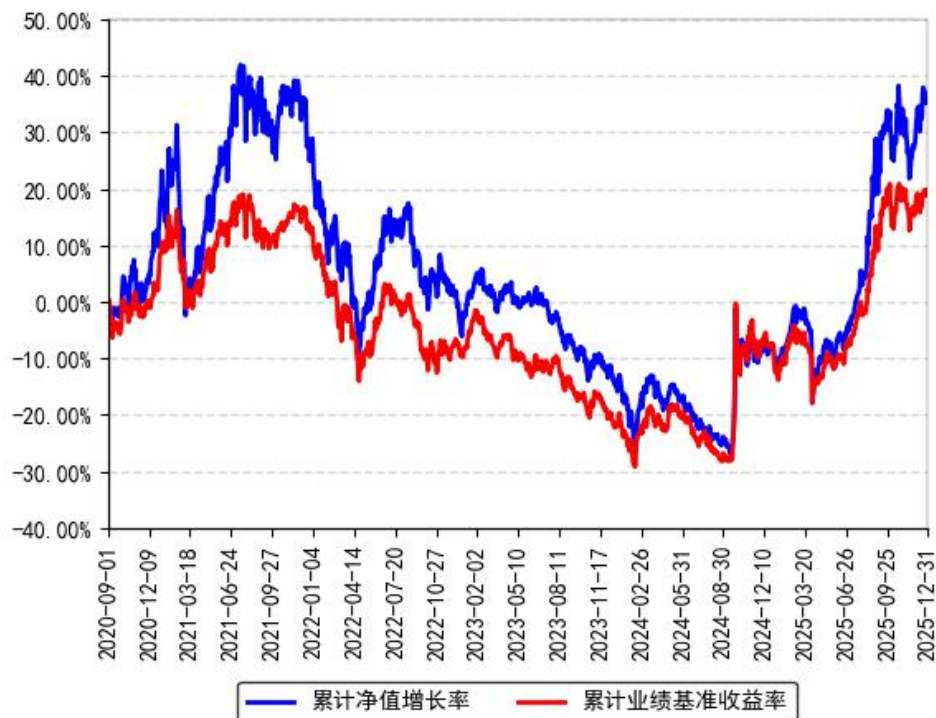
南方创业板2年定开混合累计净值增长率与同期业绩比较基准收益率的历史走势对比图